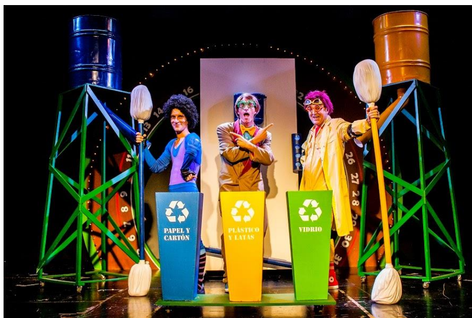
Figura 7. Ejemplo de teatro tradicional para la informar y sensibilizar sobre temas ambientales importantes para la RESMBCH.