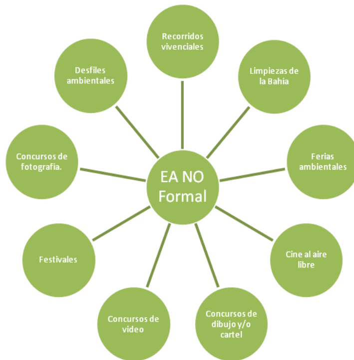
Figura 4. Alcance de las actividades de EA no formal para la RESMBCH.

El objetivo de la educación ambiental no formal se realiza generalmente en ambientes amigables y al aire libre, teniendo como base actividades lúdicas a través de las cuales se brinda la información. A continuación, se muestra un diagrama con propuestas de actividades de educación ambiental no formal para realizar en la RESMBCH (Figura 4).