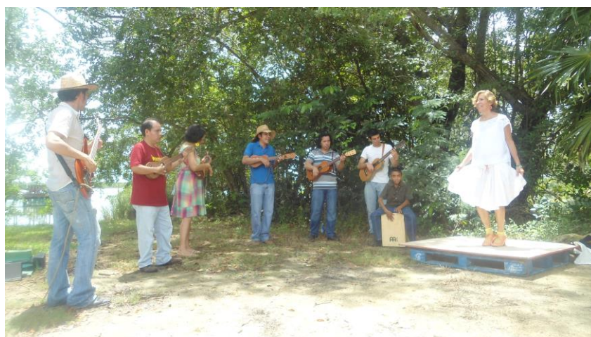
Figura 8. Ejemplo del complemento entre actividades artístico-culturales-ambientales para la difusión y sensibilización de temas ambientales en la RESMBCH.

Lo importante es siempre rescatar la cultura del lugar, en este caso aparte de resaltar los recursos naturales, se debe tener en cuenta el tipo de música (punta, reggae, Calipso, socka), baile y artesanías de la región.