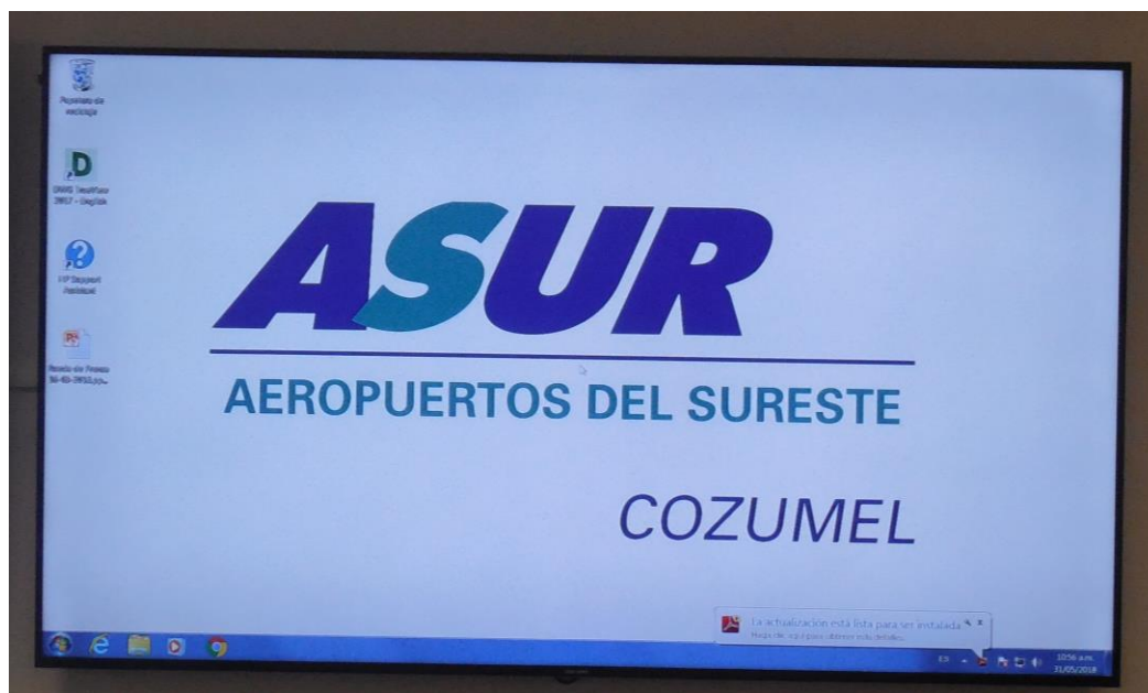
Figura 5. Ejemplo de difusión en pantallas de aeropuertos, central de camiones y aeropuerto de la ciudad de Chetumal Quintana Roo, para difundir la conservación y belleza de la RESMBCH.