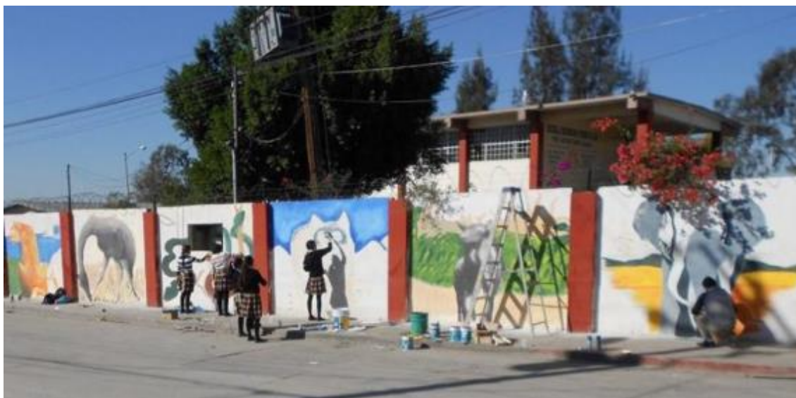
Figura 6. Ejemplo de pintado de mural en zonas como escuelas de la RESMBCH y zonas aledañas.