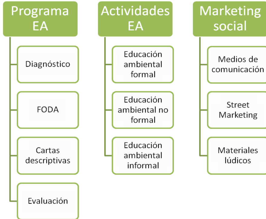
Figura 1. Esquema del contenido del Programa de EA para la RESMBCH